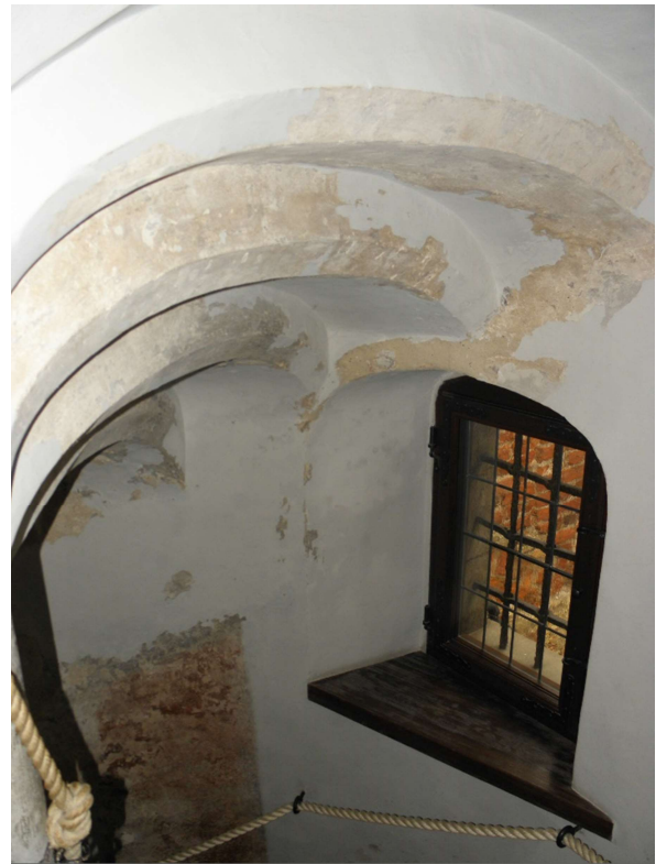
Miejsca występowania zniszczeń, obejmujące również sklepienia.