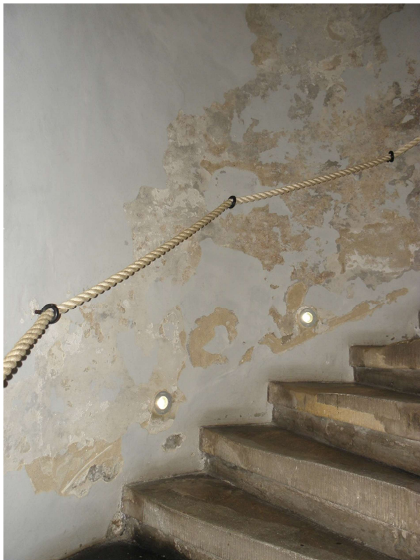
Widok ściany na parterze. Widoczne złuszczenia warstw końcowych (farby z pobiałą) oraz tynku.