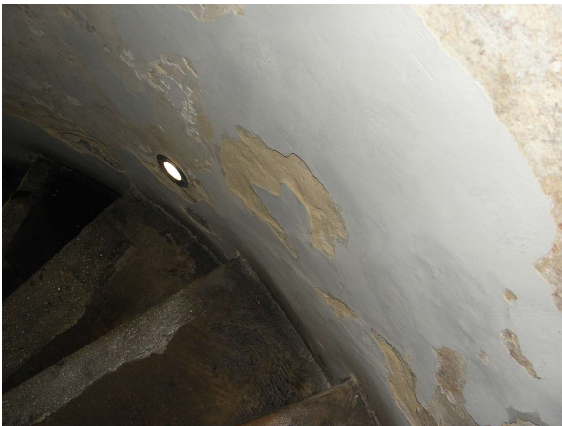
Stan zachowania tynków i powłok w partii przyziemia. Powłoki konserwatorskie pochodzą z naprawy wykonanej w 2014 r.