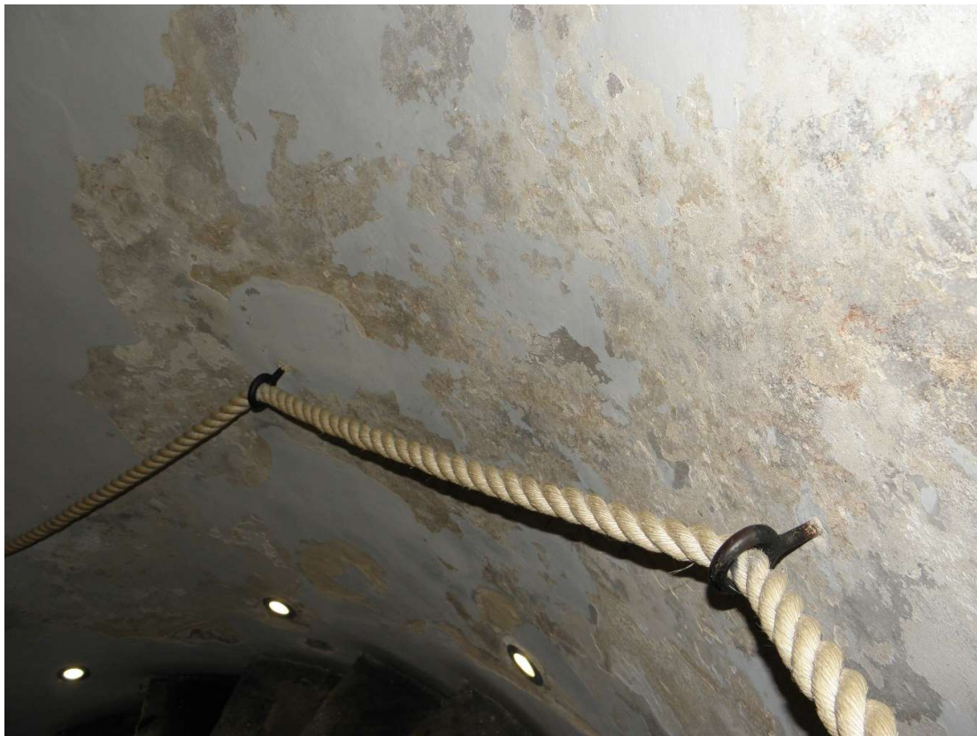
Stan zachowania tynków i powłok w partii przyziemia.