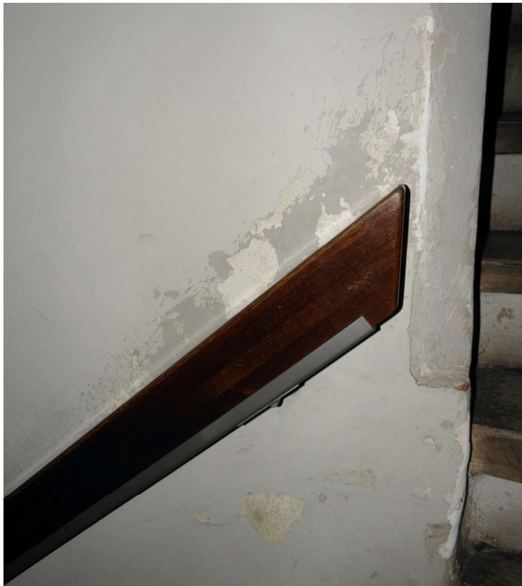
Złuszczenia w obrębie schodów, poręczy.