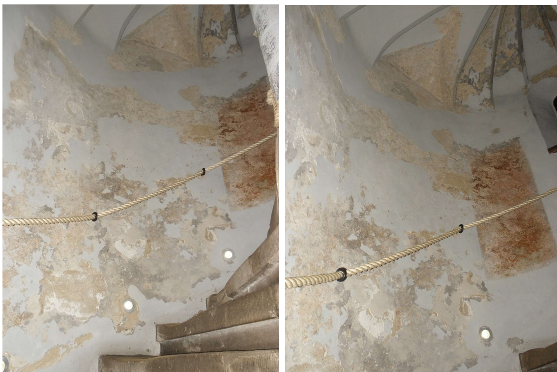
Rozległe fragmenty złuszczonej powłoki w klatce na parterze. Pod warstwą złuszczonej powłoki widoczne zachowane tynki oryginalne wraz z wyprawą barwną; po prawej wyeksponowany relikw staro tynku.