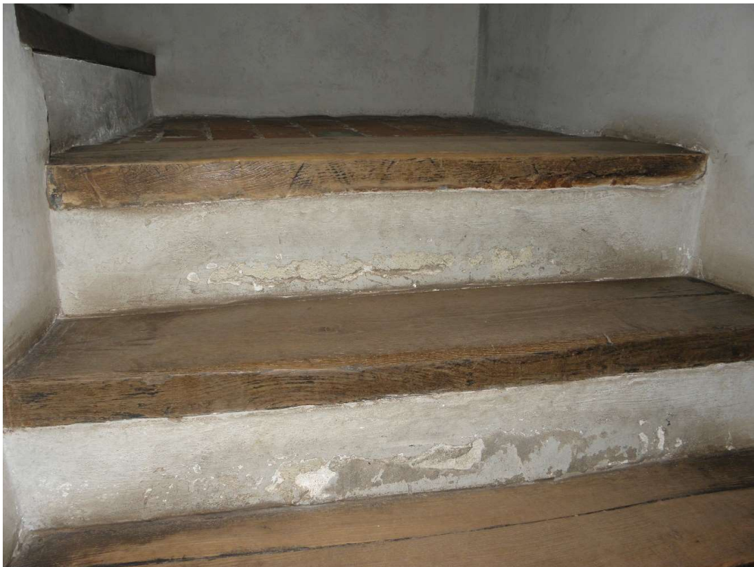
Złuszczenia w obrębie podstopnic.